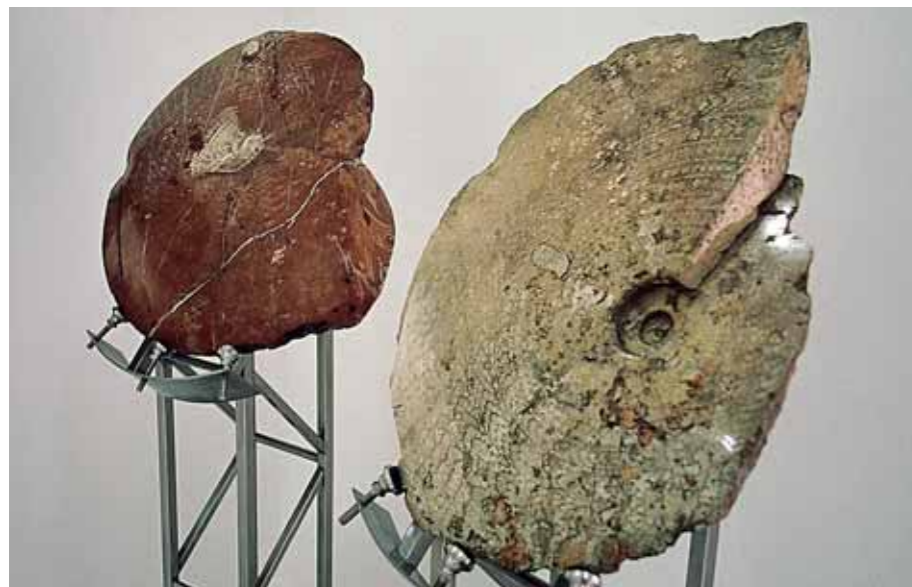
Polierte Ammoniten aus dem Hallstätter Kalk (Obertrias, 205 Millionen Jahre) bei Hallstatt (00) im Foyer der Geologischen Bundesanstalt (li.: Pinacoceras parma ; re.: Pinacoceras metternichi ).

Jahren herrschten hier Bedingungen wie heute auf den Bahamas. Was blieb, ist eine derartige Masse an zusammengeschwemmten Muschel- und Schnecken, dass man sie über Jahrzehnte als Hühnerfutter (!) abbaute. Ein letzter Fixpunkt im Miozän wären die einst zahlreichen Ziegelgruben, wo man den sogenannten Tegel als Ziegelrohstoff abbaute. Das einstige Meer begann ab 11 Millionen Jahren zunehmend zu verlanden, trotzdem hielten sich hier einzelne Spezialisten,