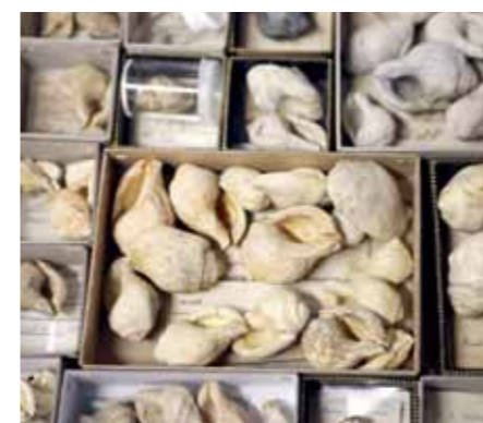
Wissenschaftliche Sammlung: Einblick in eine Lade mit Schnecken aus dem Mittleren Miozän (ca. 14 bis 13 Millionen Jahre).

men. Wenn Algen, Korallen und zahlreiche Muscheln typisch für seichtes bzw. flaches Wasser sind, dann belegen Ammoniten stets größere Wassertiefen (mehrere zehn bis hundert Meter). Oft findet man sie in roten Kalken, wobei die Farbe von Eisenoxiden herrührt. Historisch wichtige Ammonitenfundstellen befinden sich meist in den roten Kalken („Hallstätter Kalk“) des Salzkammergutes. Hier sammelte man schon im 19. Jahrhundert Ammoniten systematisch und erstellte damit