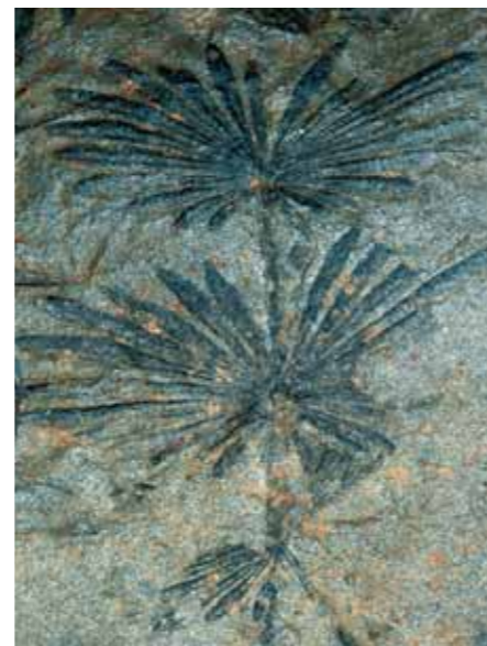
Annularia stellata , karbonzeitlicher Schachtelhalm, ca. 300 Millionen Jahre, nahe der Krone (1832 m) in den Karnischen Alpen.

Nicht, dass es dort kein Leben gäbe bzw. gab, aber körperlich erhaltene Fossilien sind hier so gut wie nicht bekannt. Der Flysch ist die Welt der Spurenfossilien; so findet man auf den Oberflächen der Sandsteinplatten oft allerlei Spuren grabender oder kriechender Organismen. Was oft wie eine Wurmspur aussieht, muss noch lange nicht von einem „Wurm“ stammen; die Welt der Spurenfossilien (Ichnofossilien) ist noch voller Rätsel. Ganz anders ist es in den Kalkalpen. Die Palette der dortigen Sedimente