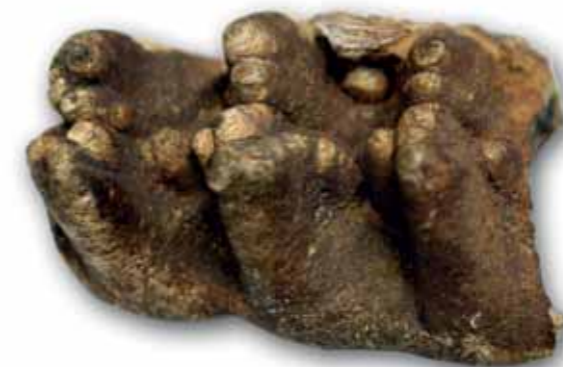
Mahlzahn eines Mastodon (Rüsseltier) aus den Schottern der Urdonau (11,5 bis 8 Millionen Jahre) bei Mistelbach.

Wer in unserem Land auf der Suche nach Fossilien ist, muss sich an Sedimentgesteine halten. Zu empfehlen sind die „jungen“ Ablagerungen der Erdneuzeit (Känozoikum), denn: je jünger Fossilien sind, desto besser sind sie erhalten. Konkret geht es um die Tone (Ziegelgruben) und Sande im Alpenvorland (Molassezone), im Wiener und Steirischen Becken. Man darf sich diese großen Beckenlandschaften vor rund 15 Millionen Jahren – um einen geologischen Moment zu definieren – als Meeresbereiche vorstellen, die von den Alpen im Süden und dem Wald- und Mühlviertel (Böhmische Masse) im Norden begrenzt waren. In Ufernähe tummelten sich da und dort Seekühe, Krokodile und anderes Getier. Stellenweise bildeten Korallen Riffe, andernorts gab es Seegraswiesen. In den offenen Bereichen lebten Muscheln, Schnecken, Haie, Rochen, Seeigel und alles, was man sonst noch aus dem Meer kennt. Eine hoch diverse Tierwelt kämpfte ums Überleben und fraß sich gegenseitig auf. Riesige Wale filterten Plankton aus dem Wasser. Als fossilreich erweisen sich dabei einzelne Regionen zu bestimmten Zeiten innerhalb des Miozäns, einem Zeitabschnitt, der vor rund 23,0 Millionen Jahren beginnt und vor rund 5,2 Milli-